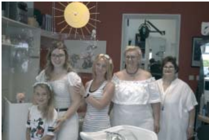
Das Team von Haarstudio M+F ■

Vereinbaren Sie liebe Leserinnen und Leser doch einfach telefonisch einen Termin für ihre nächste Frisur unter Telefon 06897/7 37 50. Das Friseurteam des Haarstudio M+F erwartet Sie.